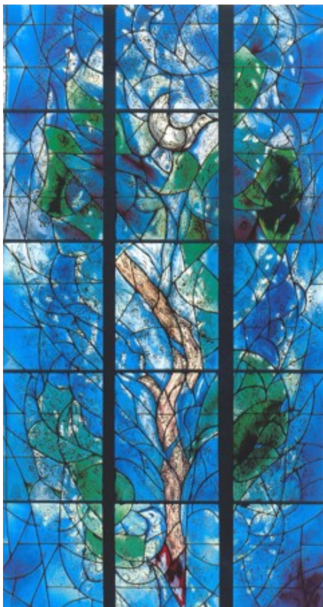
Duinzichtkerk Zondag 18 november 2018